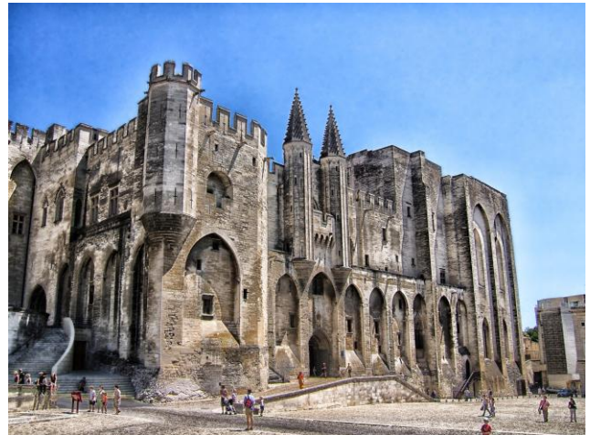
Papstpalast in Avignon

Das sogenannte „päpstliche Exil“ in Avignon bezeichnet die Zeit von 1309 bis 1377, in der die Päpste ihren Sitz nicht in Rom, sondern in der südfranzösischen Stadt Avignon hatten. Ausgelöst wurde diese Verlagerung vor allem durch politische Konflikte in Italien und den starken Einfluss der französischen Krone, insbesondere unter König Philipp IV.. Der erste Papst in Avignon war Clemens V., der aus Frankreich stammte und den Papst-hof dorthin verlegte.