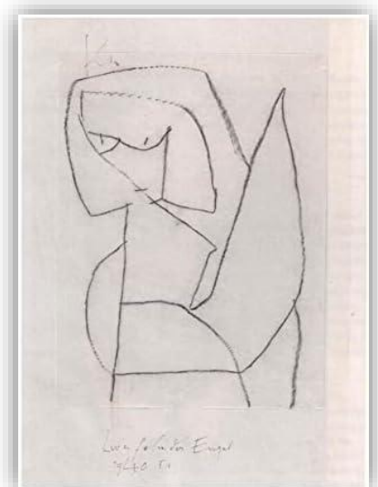
Paul Klee, Engel im Zweifel